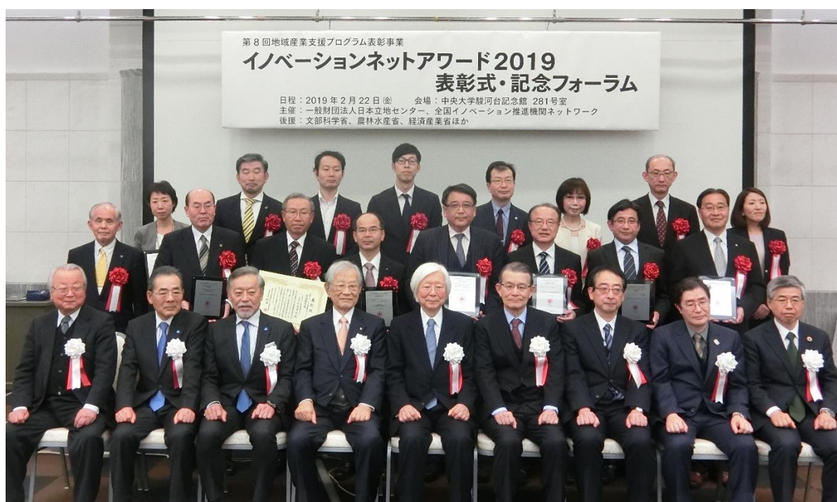
イノベーションネットアワード2019表彰式での記念撮影

地域の中小企業による新事業および新産業創出などを促進し、地域産業の振興・活性化に優れた成果を上げている「地域産業支援プログラム」を表彰します。