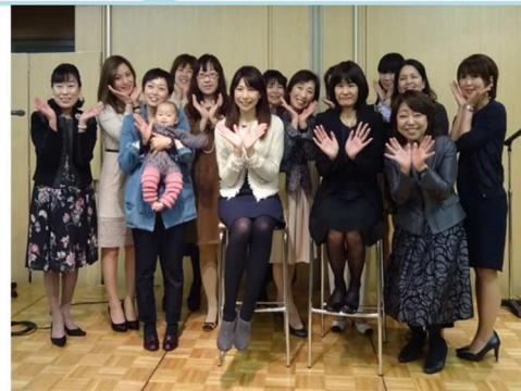
徳島県と連携 「女性起業家交流会」