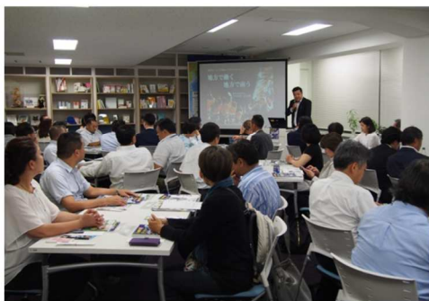
独立行政法人中小企業基盤整備機構・徳島県・東京徳島県人会と連携 「とくしま移住×シゴトづくりトークイベント」