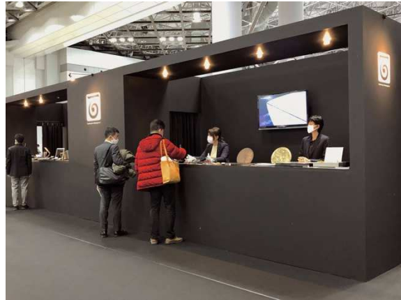
ギフトショー LIFE x DESIGN 出展