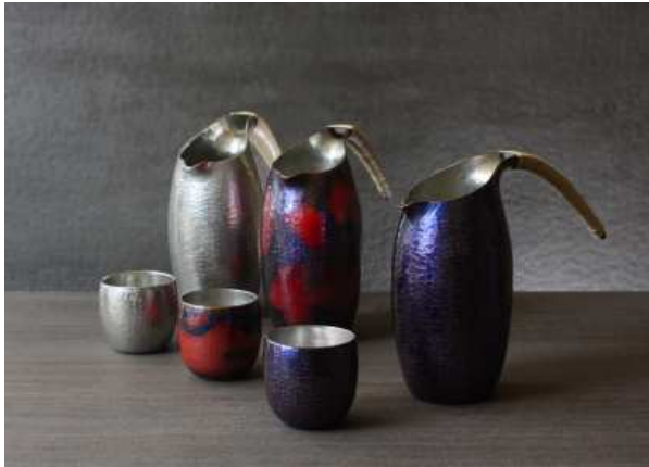
百年物語・チャレンジにより開発・上市した銅製の「酒器」