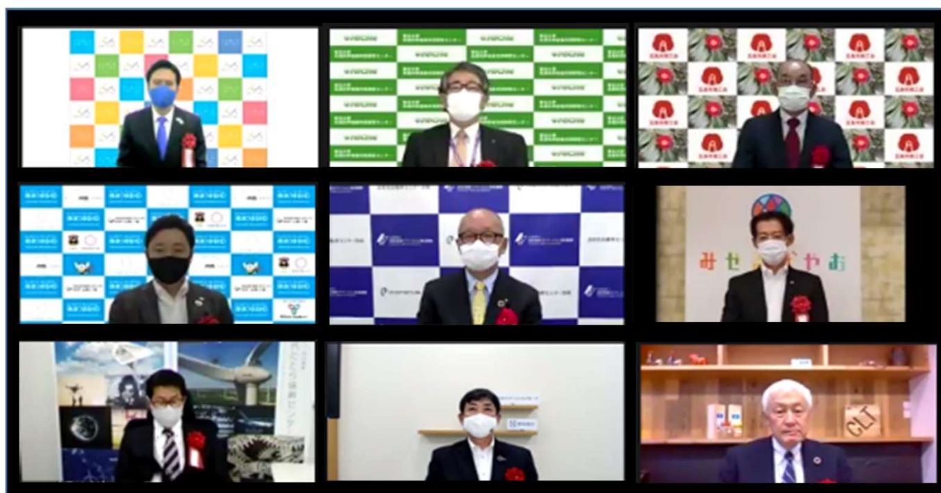
前回イノベーションネットアワード2021表彰式での受賞団体代表者及び受賞者の皆様 (オンライン形式で開催：2021年6月22日)

地域の中小企業による新事業および新産業創出などを促進し、地域産業の振興・活性化に優れた成果を上げている「地域産業支援プログラム」を表彰します。